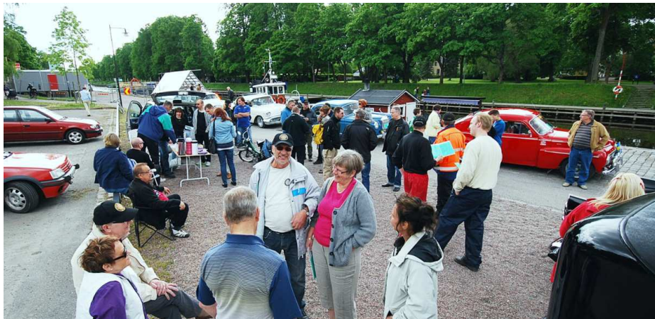
Samling vid pumpen ( kaffe) innan starten.