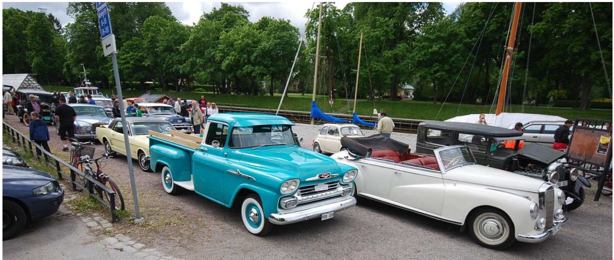
Samlingen vid hamnplan