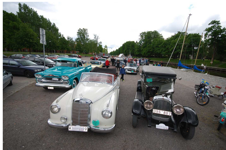
Det fylldes på med både 2 och 4-hjuliga ekipage