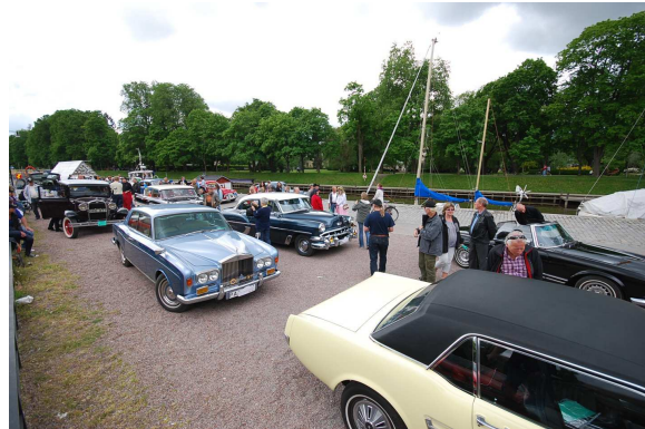
Väldigt trevlig med så många olika bilar och mopeder, bara att gå runt och njuta.